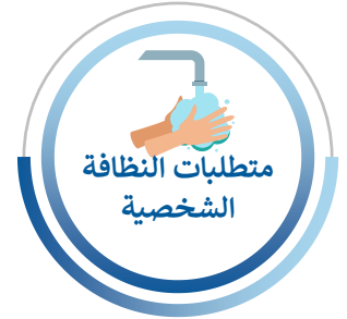
متطلبات النظافة الشخصية