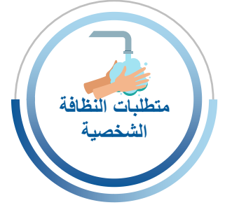
متطلبات النظافة الشخصية