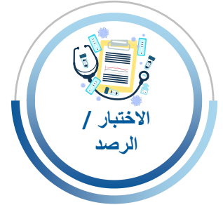
الاختبار / الرصد