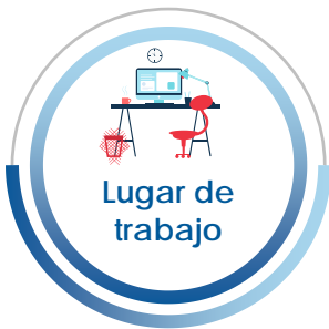
Lugar de trabajo