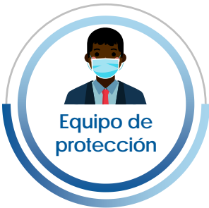
Equipo de protección