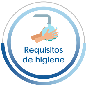
Requisitos de higiene