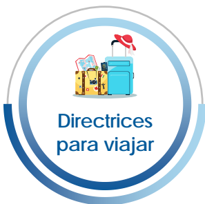
Directrices para viajar