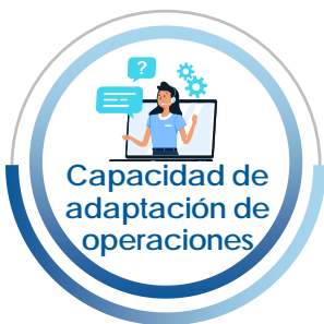
Capacidad de adaptación de operaciones