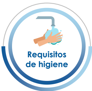
Requisitos de higiene