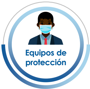
Equipos de protección