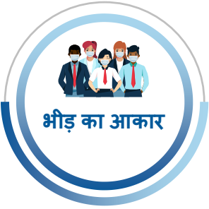
भीड़ का आकार