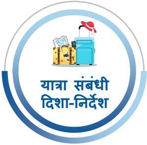
यात्रा संबंधी दिशा-निर्देश