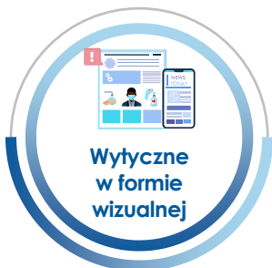
Wytyczne w formie wizualnej