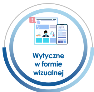
Wytyczne w formie wizualnej