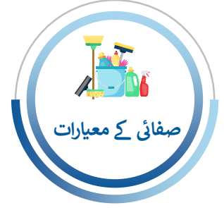
صفائی کے معیارات