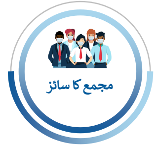
مجمع کا سائز