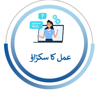
عمل کا سکرپٹ