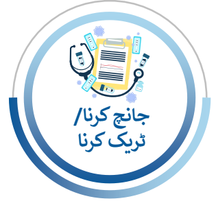
جانچ کرنا/ ٹریک کرنا