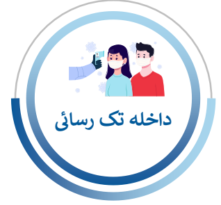
داخلہ تک رسائی